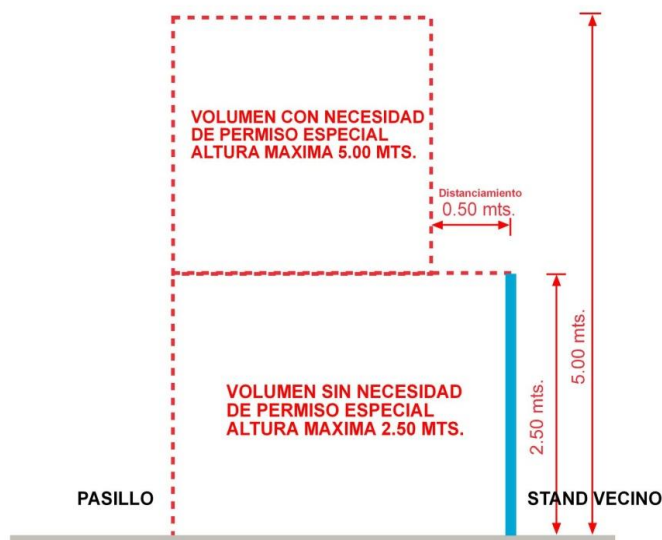
Esquema de elevación lateral